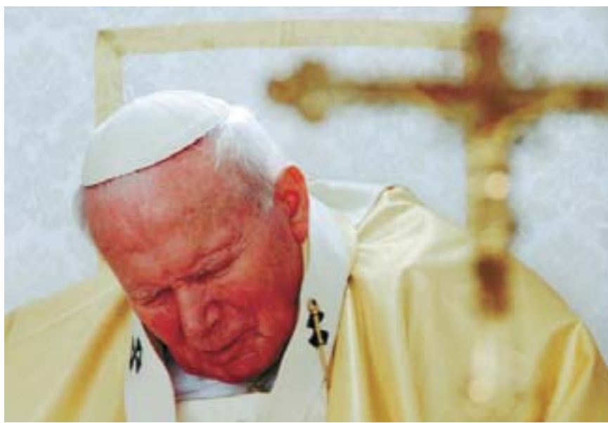
Il Papa visibilmente affaticato: è stato anche il pontefice del dolore e della sofferenza.

«Non voglio estremizzare: anche la gioia è un modo essenziale d'essere uomini. Tutto quello che Dio ti manda lo è; e pretende accettazione; accettazione d'ogni destino di gioia e di dolore. Del resto, il dolore ha come scopo la gioia: è una via alla gioia. Tutto deve finire in gioia. Ma noi siamo portati a pensare che il dolore sia una sorta di punizione: se uno non si merita un dolore, questo dolore non lo deve toccare. In qualche misura continuiamo a dipendere dalla concezione della retribuzione temporale, propria degli antichi ebrei. I quali ritenevano che ogni loro fortuna fosse conseguenza della loro virtù, fosse un premio. Al contrario, se uno era brutto lo era perché era cattivo. Una delle grandi rivoluzioni del cristianesimo è capire che non è così. Il dolore, come tutte le cose negative che possono segnare la vita, tocca in-