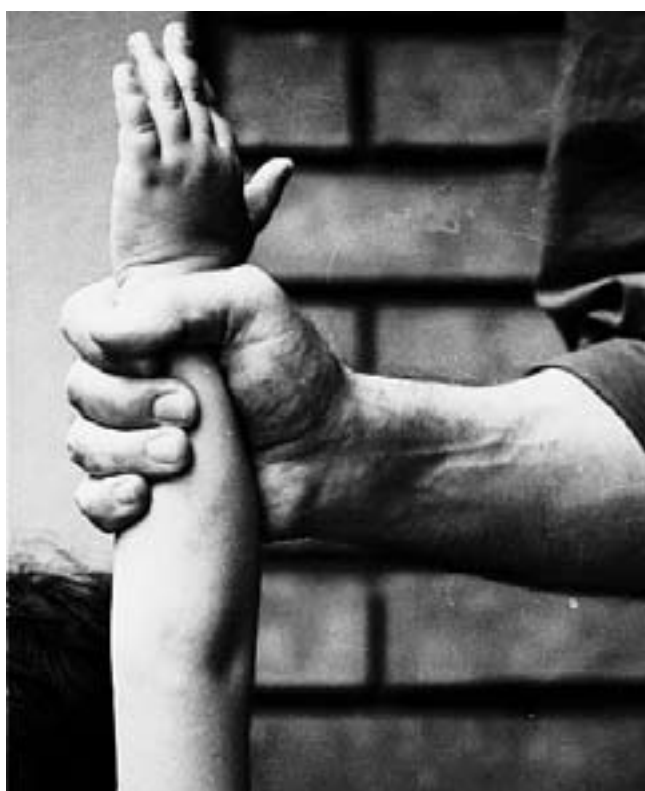
Violenza sui minori

LETTORE FEDELE, LETTORE PREMIATO Raccogli il BOLLINO FEDELTA'. Ogni giorno lo trovi in PRIMA PAGINA. 7 bollini = 2 EURO.