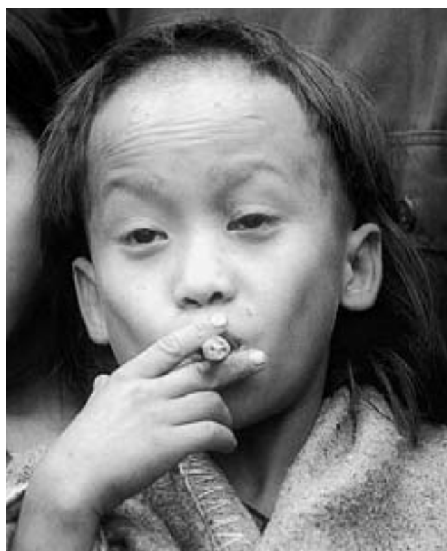
In alto: bambini soldato in Africa. A sinistra: bimbo schiavo in Asia

Trecento milioni di piccoli sono costretti oggi a lavorare, anche per 10-12 ore al giorno, a prostituirsi o a combattere le guerre al posto degli adulti